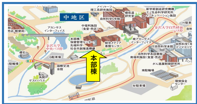
角間地区： 保健管理センター（本部棟 1階）